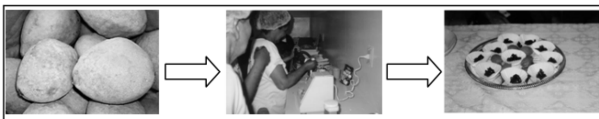
Figura 3 – Processo de elaboração de receitas caseiras de Baru.

Algumas mulheres do Assentamento Andalúcia tiveram a oportunidade de realizar curso de capacitação com nutricionistas da Universidade Católica Dom Bosco (UCDB). Elas aperfeiçoaram receitas caseiras com as normas de conduta para manipulação de alimentos (Figura 3). Além disso, a busca por alternativas de trabalho dentro do assentamento levou à criação da oficina de tecelagem. As mãos, calejadas pelo trabalho na roça, agora tecem peças delicadas. A percentagem de 70% que recebem fica com as mulheres e o restante é reinvestido na oficina. As peças, feitas sob encomenda, já foram exportadas para Alemanha, Inglaterra e Estados Unidos (MSTV, 2004).