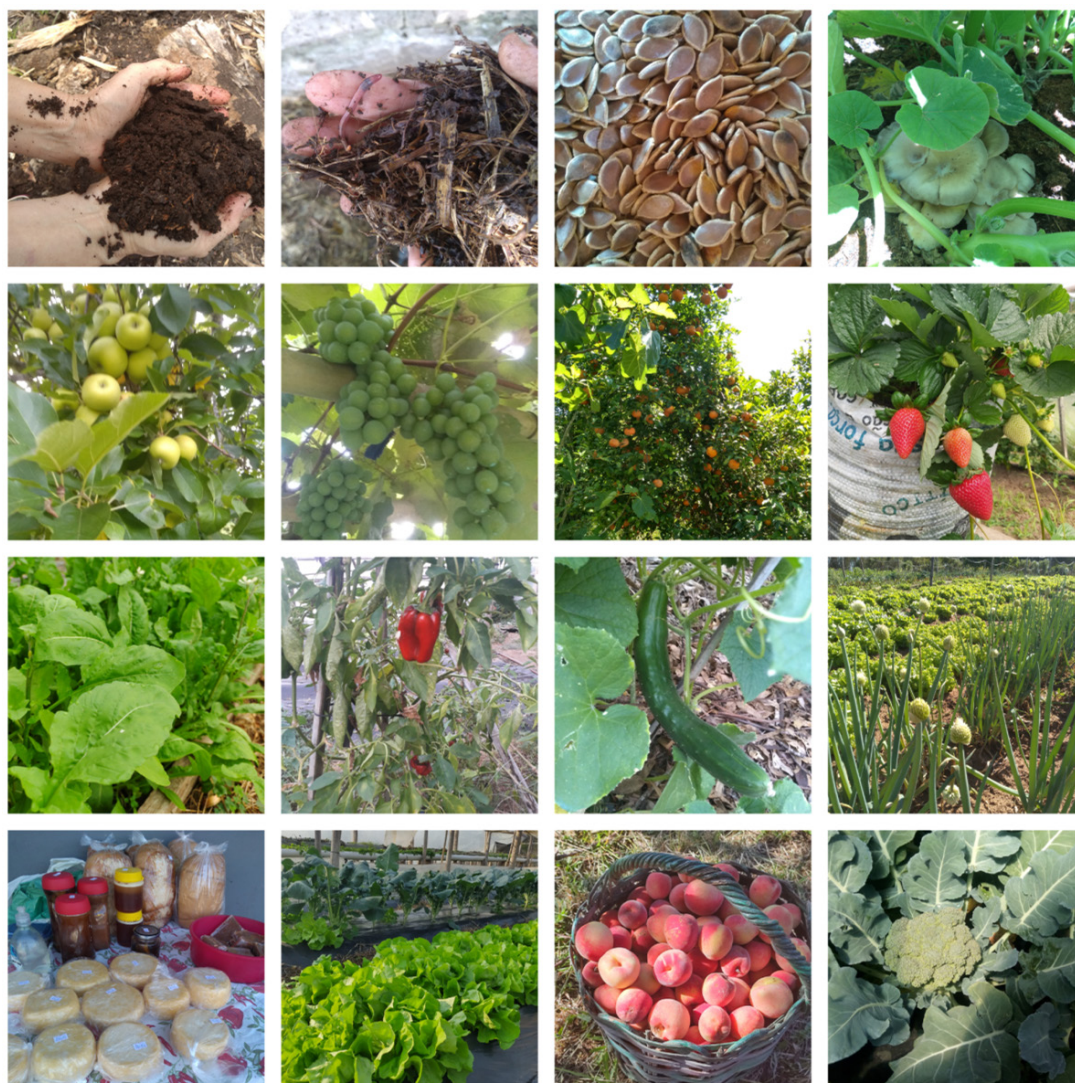
Figura 1 – Coleção de fotos representativas da dinâmica produtiva e socioeconômica das unidades de produção agroecológicas em Santana do Livramento, RS

A agricultura familiar agroecológica em Santana do Livramento tem predominância do sexo feminino, idade entre 30 e 72 anos, preponderância de formação em nível superior, naturalidade santanense e a maioria dos núcleos familiares é composta por dois integrantes. Além disso, produz alimentos como legumes, verduras e frutas, em geral, com área de plantio variando entre um e 33 hectares. Ainda, destaca-se que dois agricultores entrevistados têm a certificação social através de Organização de Controle Social (OCS), que os certifica como produtores orgânicos. A figura a seguir ilustra a prática produtiva da agricultura agroecológica que dialoga com as ações inovativas.